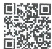
ประเทศไทย