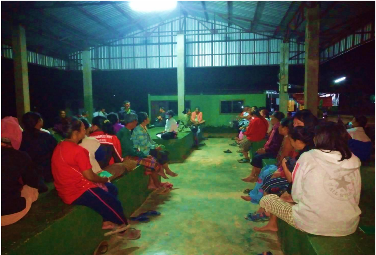
ประชุมการจัดทำแผนพัฒนาหมู่บ้าน